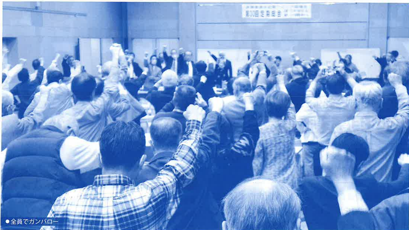
●全員でガンバロー