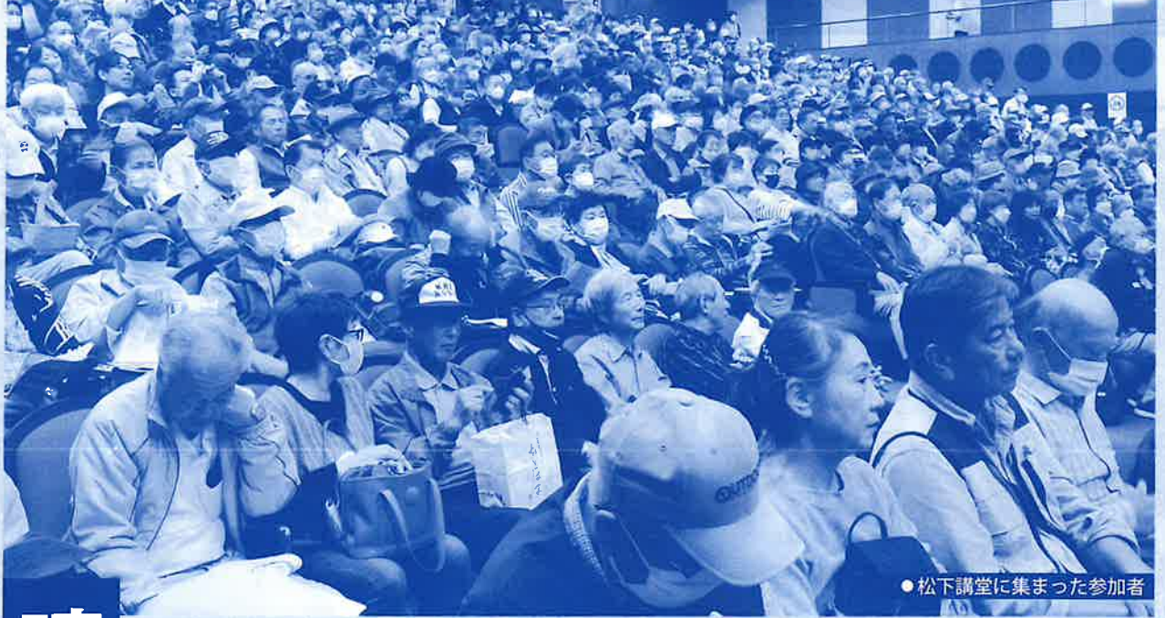
● 松下講堂に集まった参加者