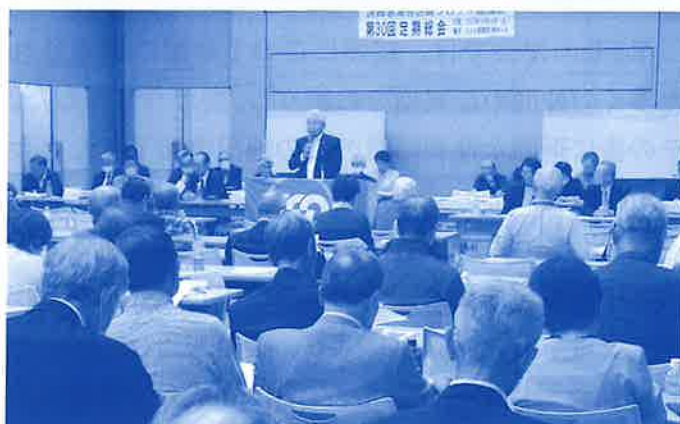
●徳永代表幹事のあいさつ