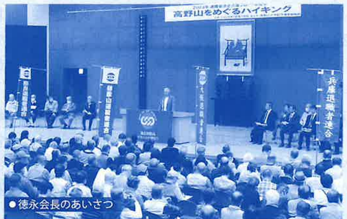
● 徳永会長のあいさつ