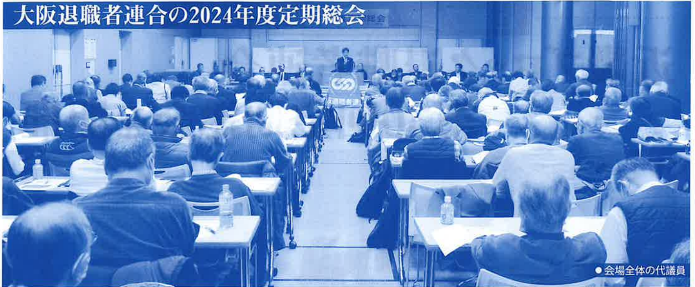
●会場全体の代議員